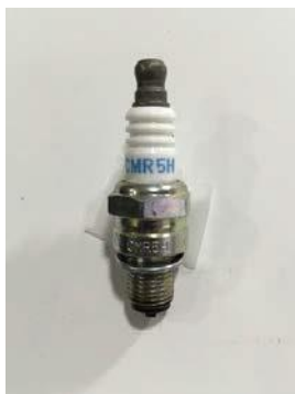
Slika : 5.2. Vžigalna svečka

Dovoljena uporaba samo originalne sklopke. Zobnik sklopke motorja 10 zob.