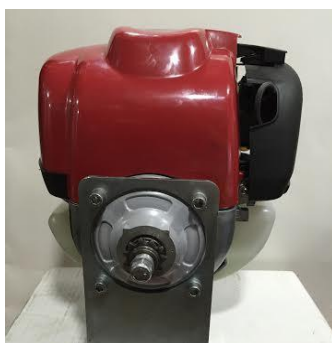
Slika : 5.1. Suha centrifugalna sklopka

Dovoljena uporaba samo originalne sklopke. Zobnik sklopke motorja 10 zob.